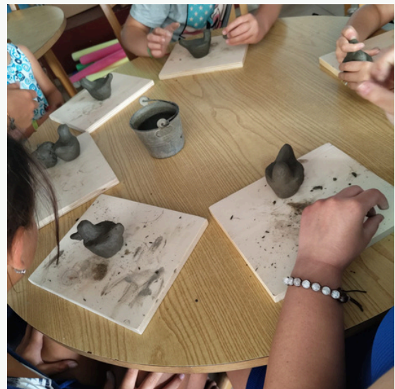
Alcune foto scattate durante i laboratori organizzati con il Museo dell'Ocarina di Grillara