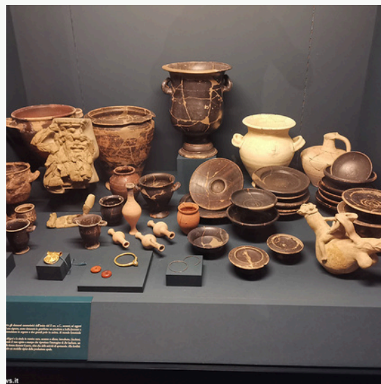
Museo Archeologico nazionale di Adria