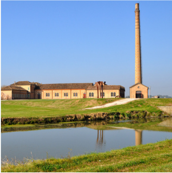
Museo regionale della Bonifica di Ca' Vendramin