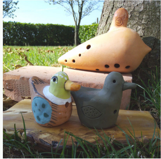
Museo dell'Ocarina, di Grillara